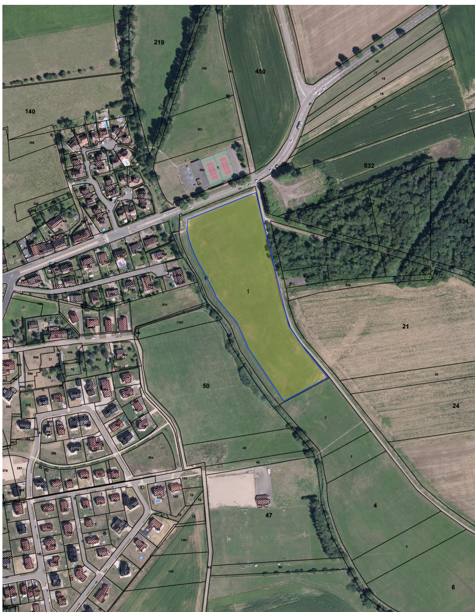
Extrait du plan cadastral & limites de la plateforme de décollage "Bessoncourt" 47°38'46"N 6°56'23"E